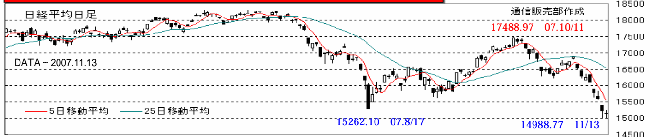
【日経平均日足】5日移動平均線カイリ率(%) & 25日移動平均線カイリ率(%)

騰落レシオとは、値上がり銘柄数と値下がり銘柄数の比率から、市場全体の過熱度を見る指標です。一般的に騰落レシオの70%以下は市場全体的に売られすぎ局面、120%以上は市場全体的に買われすぎ局面として捉えられています。騰落レシオは株価のピーク、ボトムに先行する傾向があるとされており、特に“売られすぎ局面”での信頼性が高いとされています。